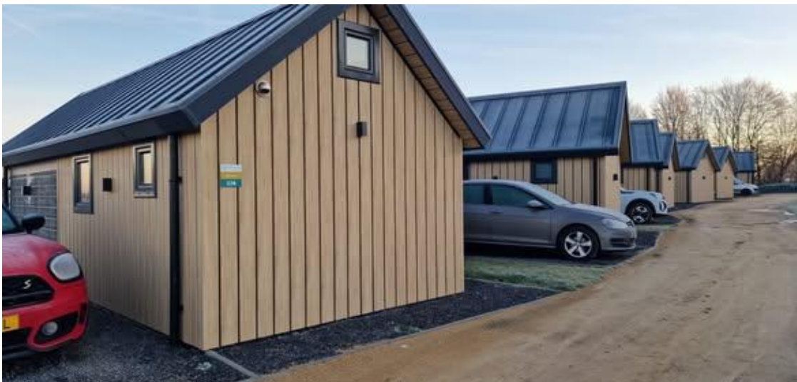
Voorbeeld van Huisjespark

De gemeenteraad van Eijsden-Margraten heeft het bestemmingsplan voor Landgoed Moerslag goedgekeurd. Enkele verbeteringen die SNG heeft aangedragen zijn wel overgenomen. Toch zijn enkele zeer belangrijke zaken blijven liggen waardoor SNG alsnog naar de Raad van State wil gaan. De belangrijkste hierbij zijn de autarkische huisjes buiten en gebied van de boerderij dus midden in het open veld. Dit vinden we echt niet kunnen ook al worden ze omzoomd door 'schaamgroen'. Er blijft sprake van verstedelijking in het open Nationaal Landschap Zuid-Limburg. Een aantal voorstellen vanuit Moerslag zijn dusdanig ruim omschreven waardoor toch nog zeer ongewenste ontwikkelingen kunnen plaatsvinden. Daarbij heeft de gemeenteraad de verdere afhandeling in handen van B&W gelegd en dat lijkt ons helemaal geen goed signaal.