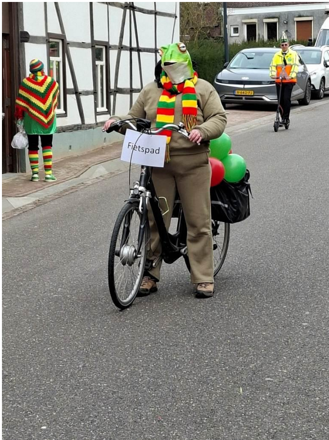
Carnavaloptocht Eys – ludiek protest!

Ook de andere Heuvelland gemeentes hebben het boek mogen ontvangen.