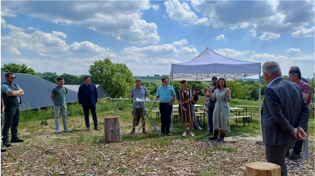
Ondertekening samenwerking SBB en de Hofkamer

Op uitnodiging van de raad van de gemeente Vaals heeft o.a. Stichting Natuurlijk Geuldal een voordracht gegeven over de schade die ontstaat aan het landschap en de biodiversiteit indien de voormalige camping Cottesserhoeve een huisjespark zou worden. De raad en commissie waren onder de indruk van ons verhaal en hopelijk heeft dit invloed op de besluitvorming waardoor het gebied Cottessen - Camerig (wellicht het mooiste gebied van Nederland!) gespaard blijft van een huisjespark. De toekomst zal het uitwijzen.